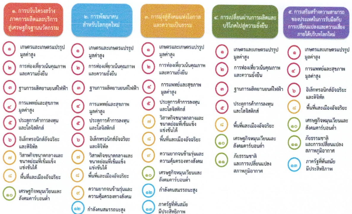
แผนภาพที่ ๓.๑ ความเชื่อมโยงระหว่างหมวดหมู่การพัฒนากับเป้าหมายหลัก

ความเชื่อมโยงระหว่างหมวดหมู่การพัฒนากับเป้าหมายหลักแสดงไว้ใน แผนภาพที่ ๓.๑ โดย หมวดหมู่การพัฒนาที่กำหนดขึ้นเป็นประเด็นที่มีลักษณะเชิงบูรณาการที่ครอบคลุมการพัฒนาดังแต่ในระดับต้นน้ำจนถึงปลายน้ำ และสามารถนำไปสู่ผลพัฒนาทั้งในมิติเศรษฐกิจ สังคม ทรัพยากรธรรมชาติและสิ่งแวดล้อมไปพร้อมๆ กัน ทำให้หมวดหมู่แต่ละประการสามารถสนับสนุนเป้าหมายหลักได้มากกว่าหนึ่งข้อ นอกจากนี้ การพัฒนาภายใต้แต่ละหมวดหมู่ไม่ได้แยกขาดจากกัน แต่มีการสนับสนุนหรือเอื้อประโยชน์ซึ่งกันและกัน