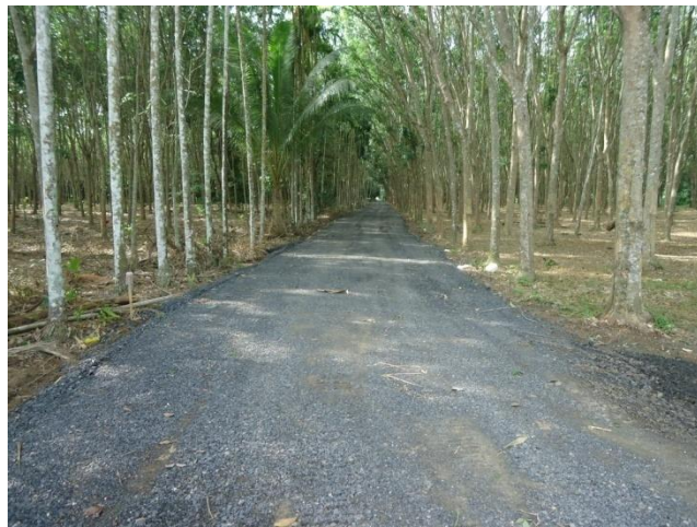
โครงการก่อสร้างถนนลาดยางผิวจราจรแอสฟัลท์ติกคอนกรีต สายเขานา - เขापนมวัง หมู่ที่ 9 ตำบลกรูด อำเภอกาญจนดิษฐ์ จังหวัดสุราษฎร์ธานี