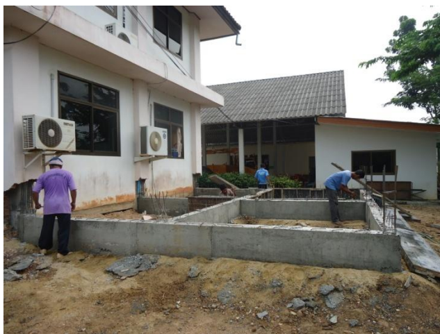
โครงการสนับสนุนการจัดทำแผนชุมชน