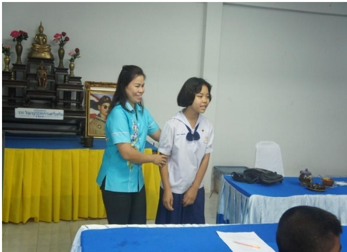
โครงการป้องกันและแก้ไขปัญหาคูบตีเหตุทางถนนในเขตตำบลกรุด